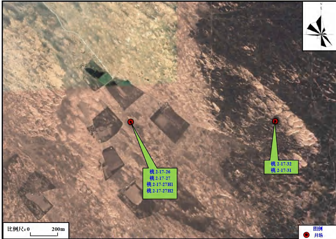
图 3-1 项目环境保护目标图（1）