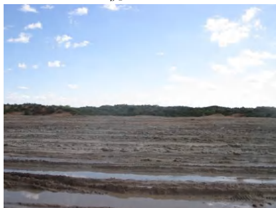
井场植被恢复情况