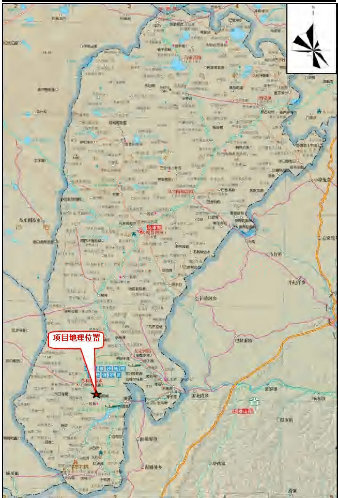
图 4-1 建设项目地理位置图