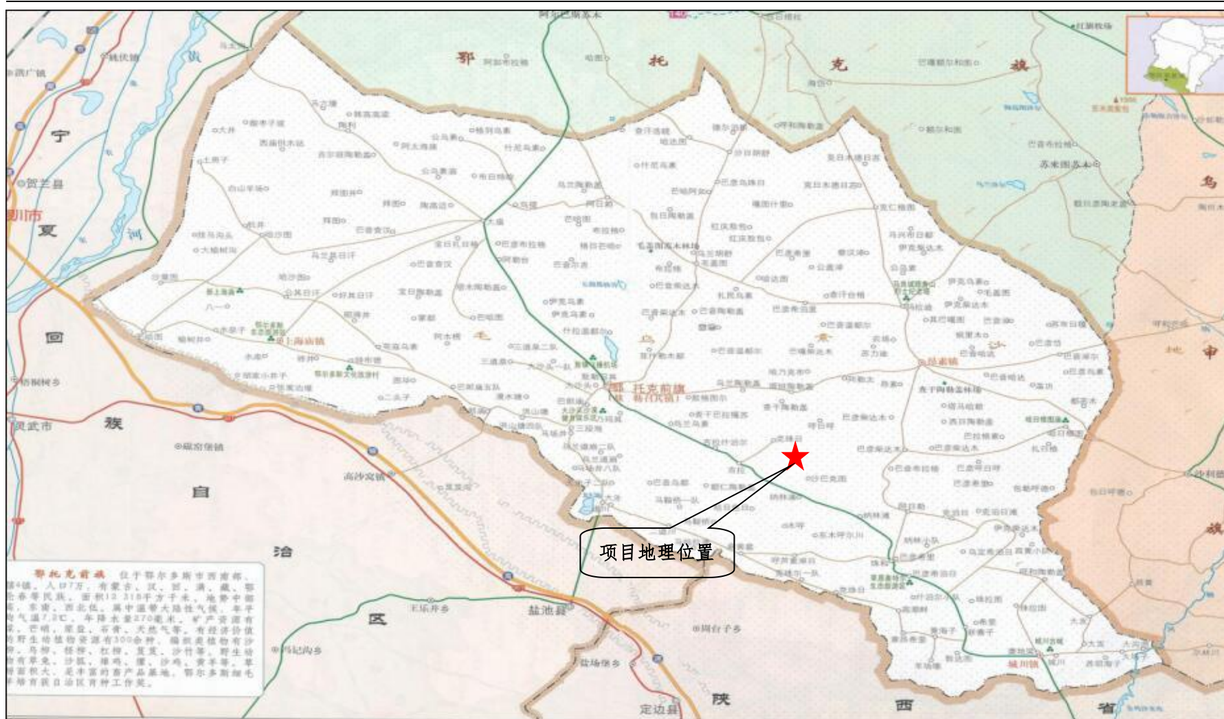
图 4.1-1 项目地理位置图