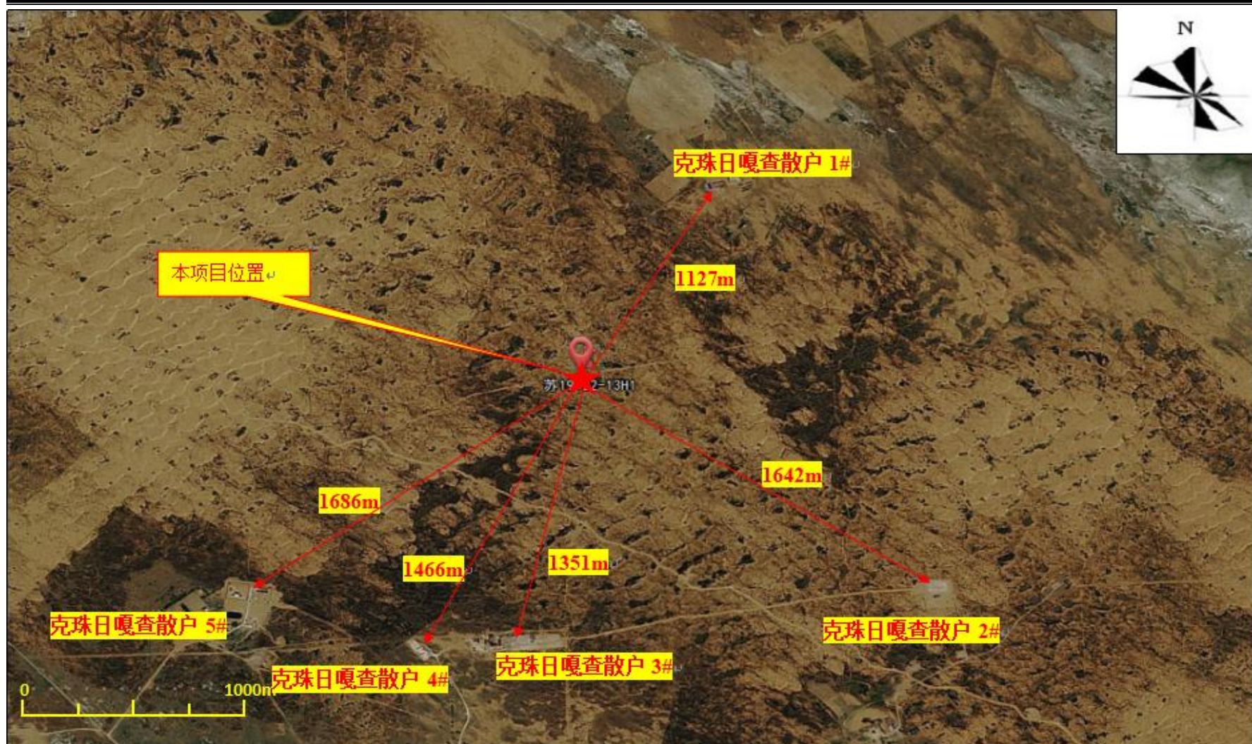
图 3-1 项目周边关系图