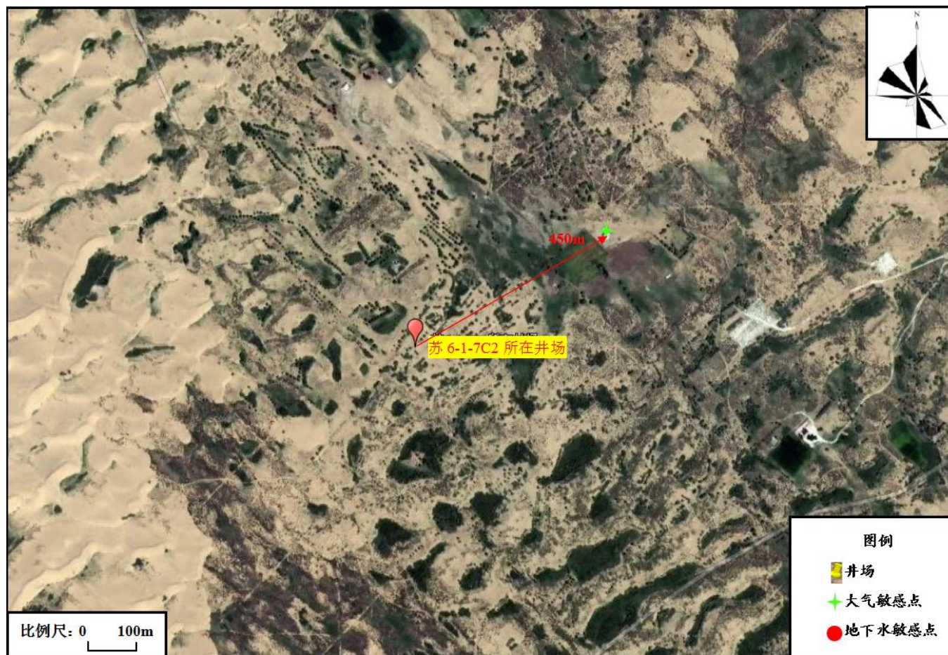
图 3-1 项目井位周边关系图