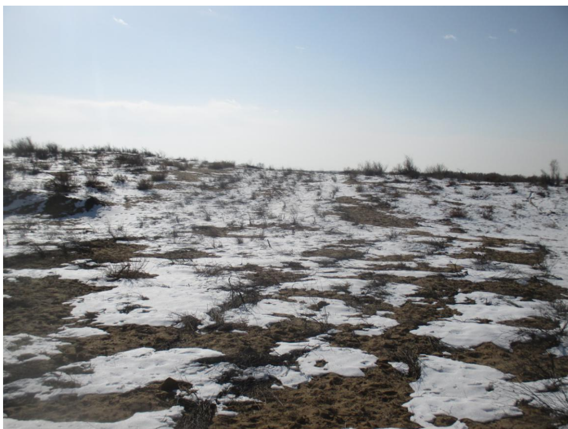
管线植被恢复情况