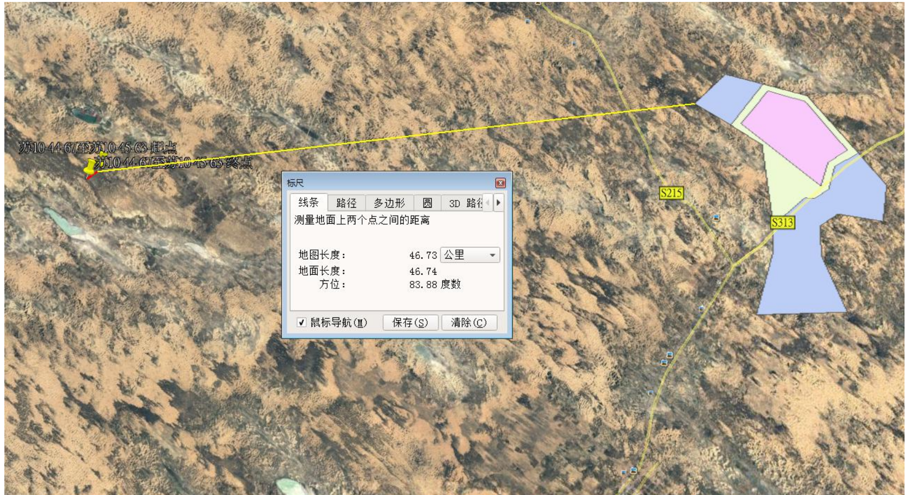
最近管线与毛乌素沙地柏自治区级保护区相对位置关系图