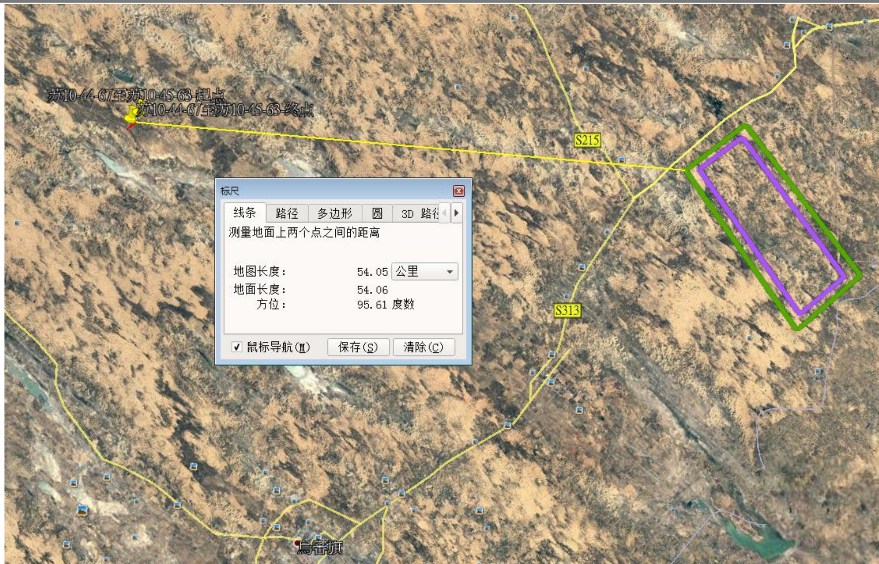
最近管线与哈头才当水源地相对位置关系图