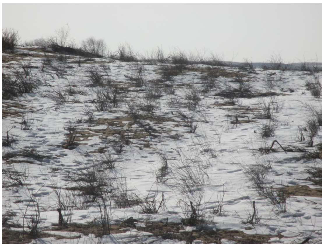
管线植被恢复情况